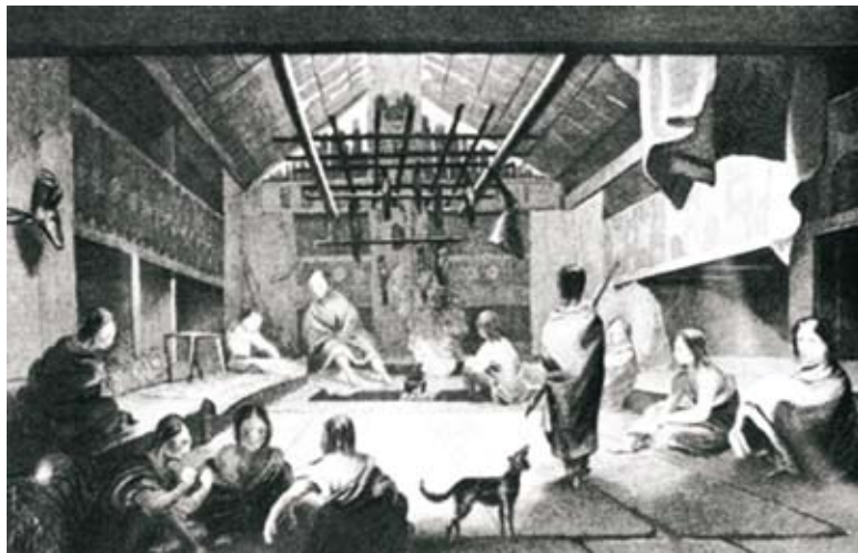
Interieur van een houten huis van de Chinookstam in de jaren 1850.

De positie van een clanleider was erfelijk. Hij werd opgevolgd door zijn oudste zoon maar als deze niet geschikt geacht werd kon het zijn dat een andere zoon hem opvolgde. Dat was vaak een zoon met een buitengewoon geheugen, die goed leiding kon geven, die de grootste opbrengst van zalm e.a. kon verzekeren. Kennis om leiding te geven werd als