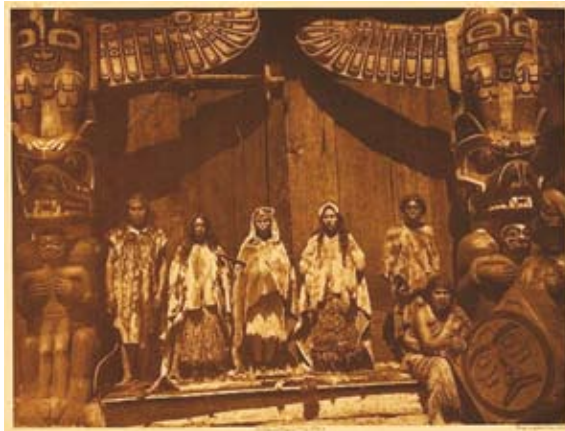
Een Kwakwaka'wakw-potlatch met dansers en zangers.

productiever waren, een deel van hun overschotten afstonden aan stammen die een slecht jaar hadden gekend. De clans die voedsel weggaven bevestigden op die manier hun eigendomsrechten op hun gronden want één van de alternatieven voor de giften was dat de andere groep op hun gronden ging vissen wat kon leiden tot oorlog. Iedere oorlog hield een kans in dat een (sub)clan zware verliezen leed en verdween. Deze versie van de potlatch vermeed een gewapend conflict. Potlatchen gingen meestal door in het winterseizoen en vroege zomermaanden wanneer er veel minder werk was. (Oberg, p.20-22)