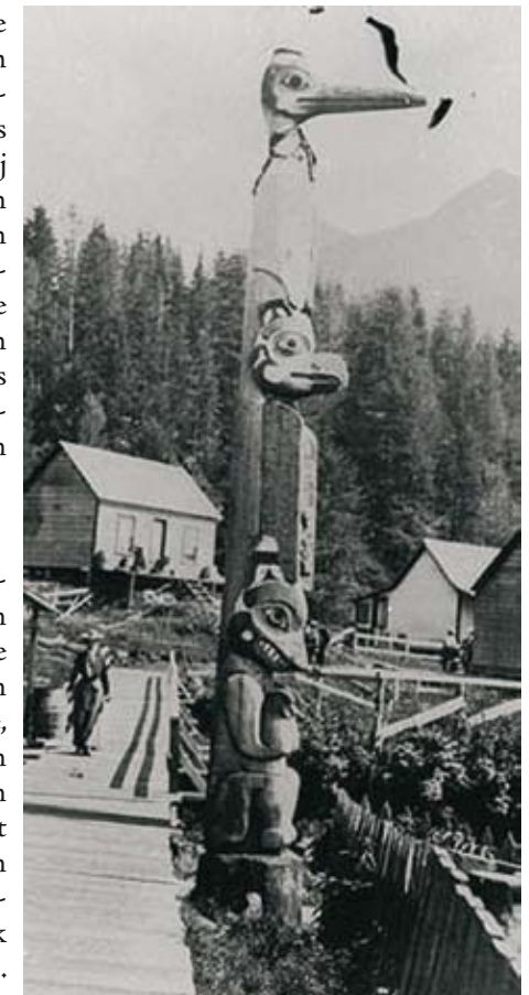
Tlingit totempaal (Foto 1901)

De potlatch was ook een systeem waarbij stammen die een goed zalmjaar hadden, of